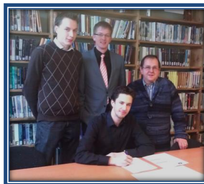
Achter de tekentafel