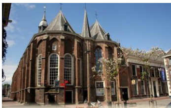
De Broederkerk in Kampen

In februari 2013 is Veritas van start gegaan in Kampen. Vanuit wijkgemeente 3 van de PKN (Broederkerk) wordt Module 1 gevolgd door 18 deelnemers, die ik mag begeleiden. Er is een goede sfeer en onderlinge betrokkenheid. Het is iedere keer genieten. Een deelnemster schreef