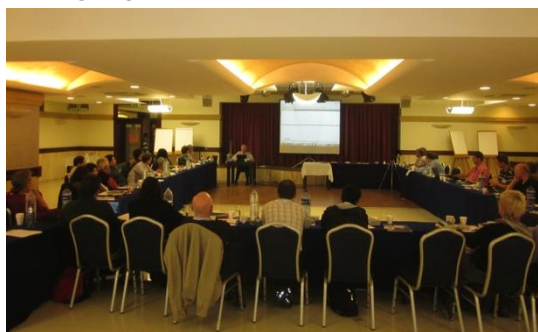
Een van de vele sessies tijdens de conferentie

Tijdens de sessies en de maaltijden was er voldoende gelegenheid om met andere werkers (35 in