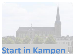
Start in Kampen

Het doel van de conferentie was naast ontmoeting en uitwisseling ook het bepalen van strategie voor de toekomst. Zo hebben we met z'n drieën een vijfjarenplan opgesteld met onze belangrijkste doelen.